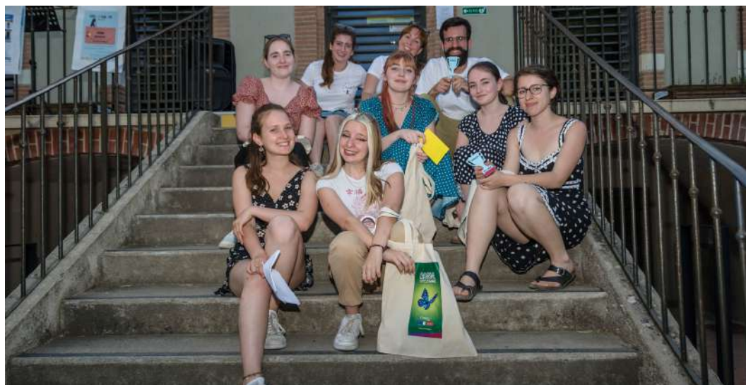
Les gagnants du concours de chant

Notre événement de la Journée de l'Europe a eu lieu le dimanche 15 mai. De nombreux mois de travail se sont traduits par une journée pleine de musique, de culture, de nourriture, de bonne ambiance et un public qui a apprécié toutes les activités proposées. Merci encore à tous ceux qui ont fait ce long voyage et qui nous ont accompagnés pour apprécier la diversité et la culture européenne, les principales valeurs que nous avons voulu transmettre. Si vous n'avez pas pu venir, ne manquez pas ce résumé du plaisir que nous avons eu !