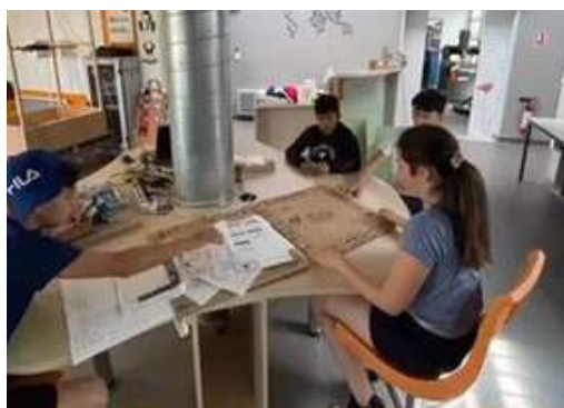
Dans le Créalab avec les jeunes /MJC Graulhet

Comme ce projet se déroule chaque année, on se met d'accord sur une thématique et cette fois, on vous a présenté «la famille» avec toute sa complexité sous la forme d'un petit spectacle. Avant, chaque participant se penchaient sur ce qu'est la famille et comment c'est de vivre ensemble, en regardant les points positifs et négatifs. Comme nous vivons tous dans une famille, c'est important de se confronter avec la conduction familiale et comment elle fonctionne.