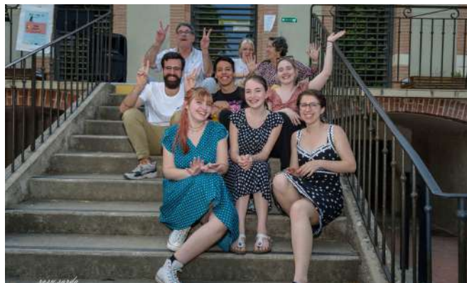
Quelques-uns des participants au concours de chant

Par le biais de jeux, de nourriture et de musique, des personnes de tous âges sont venues essayer nos propositions. Sans aucun doute, un moment très convivial au cours duquel nous avons tous passé un bon moment et appris un peu plus sur la culture européenne.