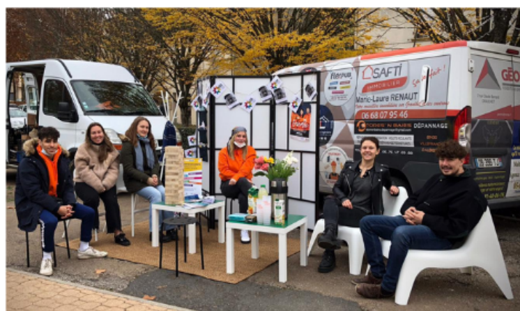
Partie de l'équipe du projet sur le marché local / MJC Graulhet.

L'objectif principal est de repérer et de recruter les jeunes invisibles du bassin graulhétos afin de les accompagner vers des parcours intermédiaires individualisés et de les suivre jusqu'à leur (re)mobilisation sur les dispositifs de droit commun. En bref, créer une relation de confiance afin que les jeunes aient à leur disposition toutes les informations dont ils ont besoin.