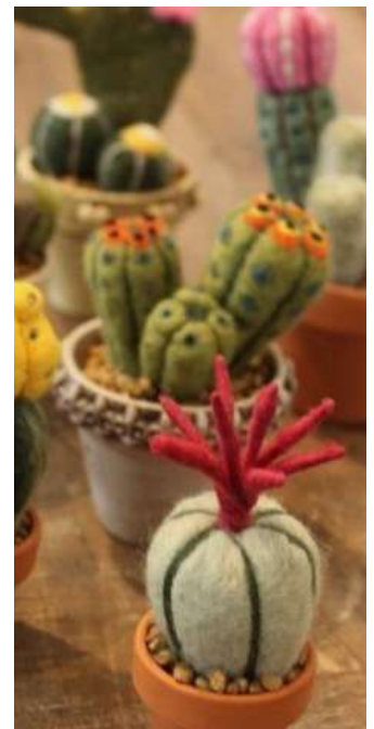
Cactus fabriqués dans l'atelier / MJC

Ici, vous voyez des plantes faites avec du feutre lors d'un stage à la MJC de Graulhet. C'est un bon exemple pour montrer qu'à part des Action Jeunes, il y a encore beaucoup d'ateliers, activités et événements. L'art et la création ne sont pas réservés aux enfants et il n'est jamais trop tard pour s'y former.