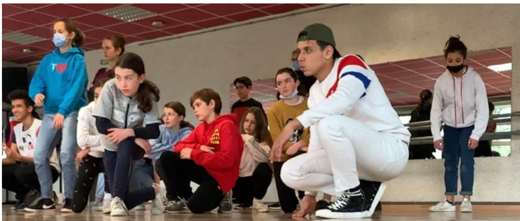
Des jeunes dansent le Hip-hop avec l'équipe de Dans6T

Ainsi, on voit la différence entre les deux possibilités qui forment le programme de la première semaine de la MJC. Il est important qu'il y ait des options variantes pour que les jeunes soient satisfaits et apprennent des qualités différentes.