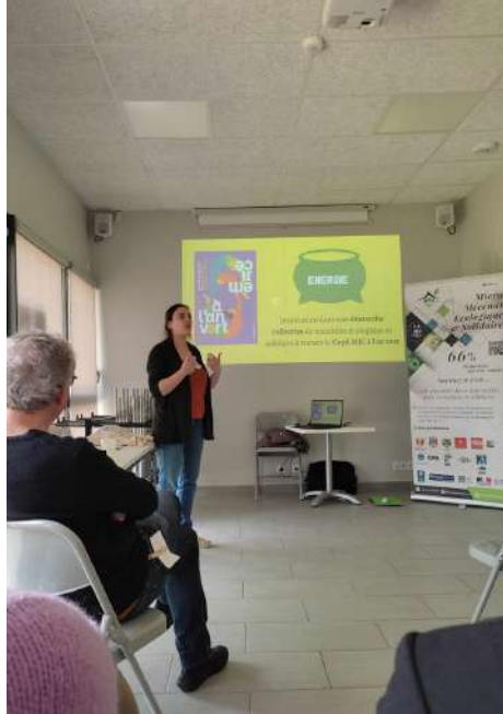
Atelier de partage entre les MJC d'Occitanie / MJC Graulhet

L'accent a été mis sur l'échange. Organisé à la MJC Puylaurens, il y avait des ateliers pour mieux se connaître, un forum d'actions et d'initiatives pour connaître la transition écologique et solidaire au sein du réseau, un atelier pour créer notre vision sur quel électron vert nous voulons être et un espace de discussion. Grâce à cela, nous avons pu apprendre beaucoup de choses sur la manière d'intégrer cette initiative dans notre vie quotidienne et, pour nous, cela a été une grande source d'inspiration. Merci pour tout.