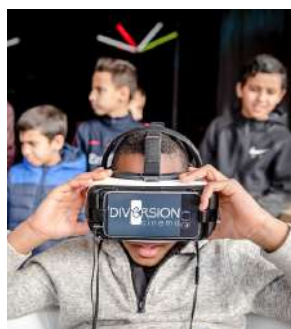
MF Sevrans - Réalité virtuelle

Le projet culturel "Micro-Folie" vient à Graulhet pour proposer une multitude d'activités pour tous les publics. Parmi elles, un musée numérique avec les œuvres les plus précieuses, des expositions, des concerts... Une excellente façon de profiter de la culture dans le centre de la ville.