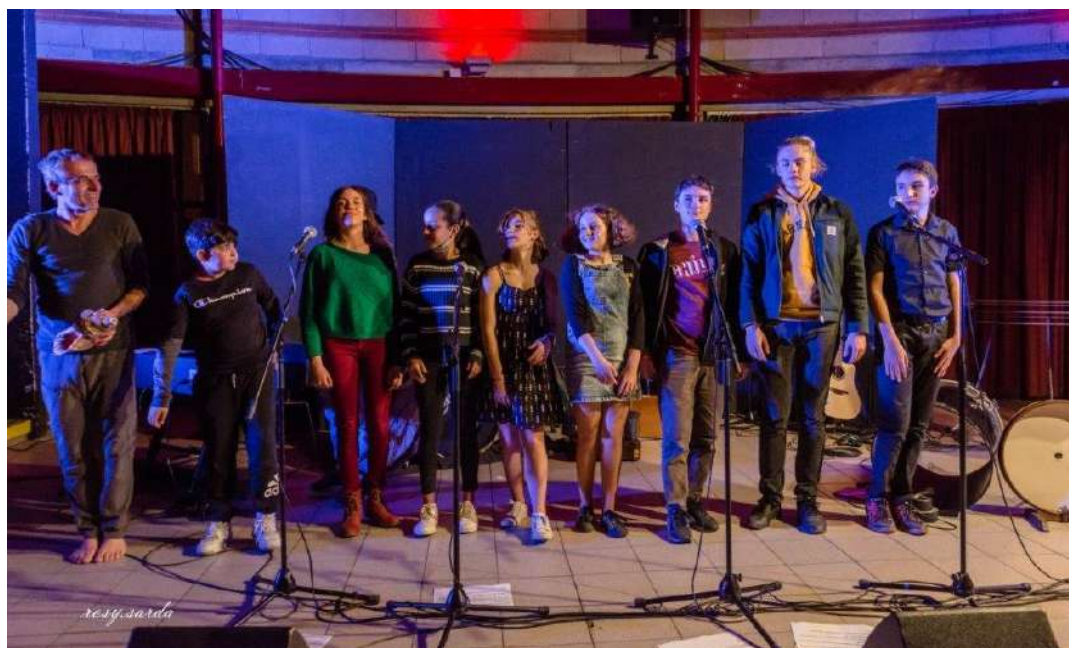
Stage musical à Gaillac - Rosy.sarda

Pendant une semaine, le trio musical Vertumne a collaboré à une scène musicale avec les jeunes des MJC de Graulhet et de Gaillac, pour aboutir à un grand spectacle plein de créativité qui a montré tout ce qu'ils ont appris grâce au talent.