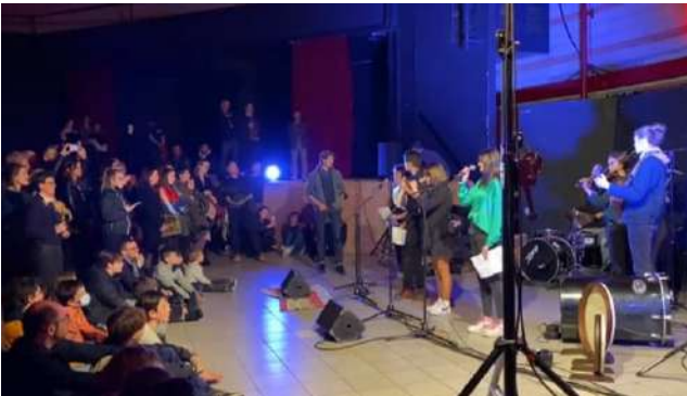
Les jeunes de la MJC chantent leur création

En plus, après la restitution - qui été composée de 3 morceaux différents - tous les participants pouvaient aller au concert du trio Vertumne gratuitement et profiter de leur musique. Pour être honnête, sa musique n'était pas ce à quoi nous nous attendions, car ils ont employé une technique spéciale : le « piano préparé » utilisant du scotch blindé, la scie circulaire ou un marteau , mais quand même on était contents de les avoir entendu.