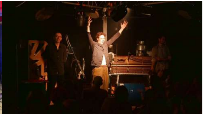
Le trio Vertumne en représentation / Instagram : @manugalure